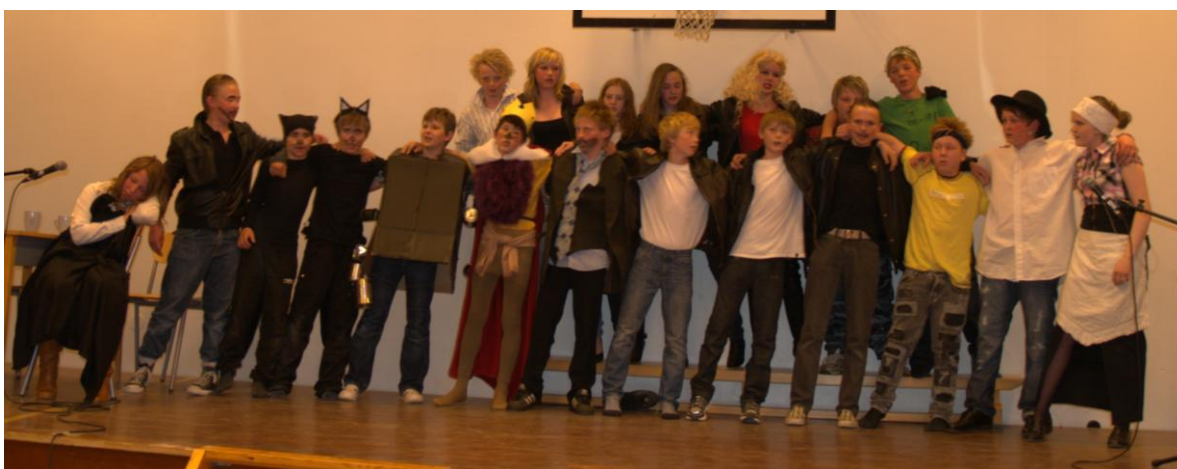
Frå avsluttinga på musikalen til 7. klasse på Åheim skule

Elles var vi innom vakre jenter og barske gitar, med både rock og peace and love. Alle dei flinke levane på scena kosa seg, og det vonar vi at publikum også gjorde